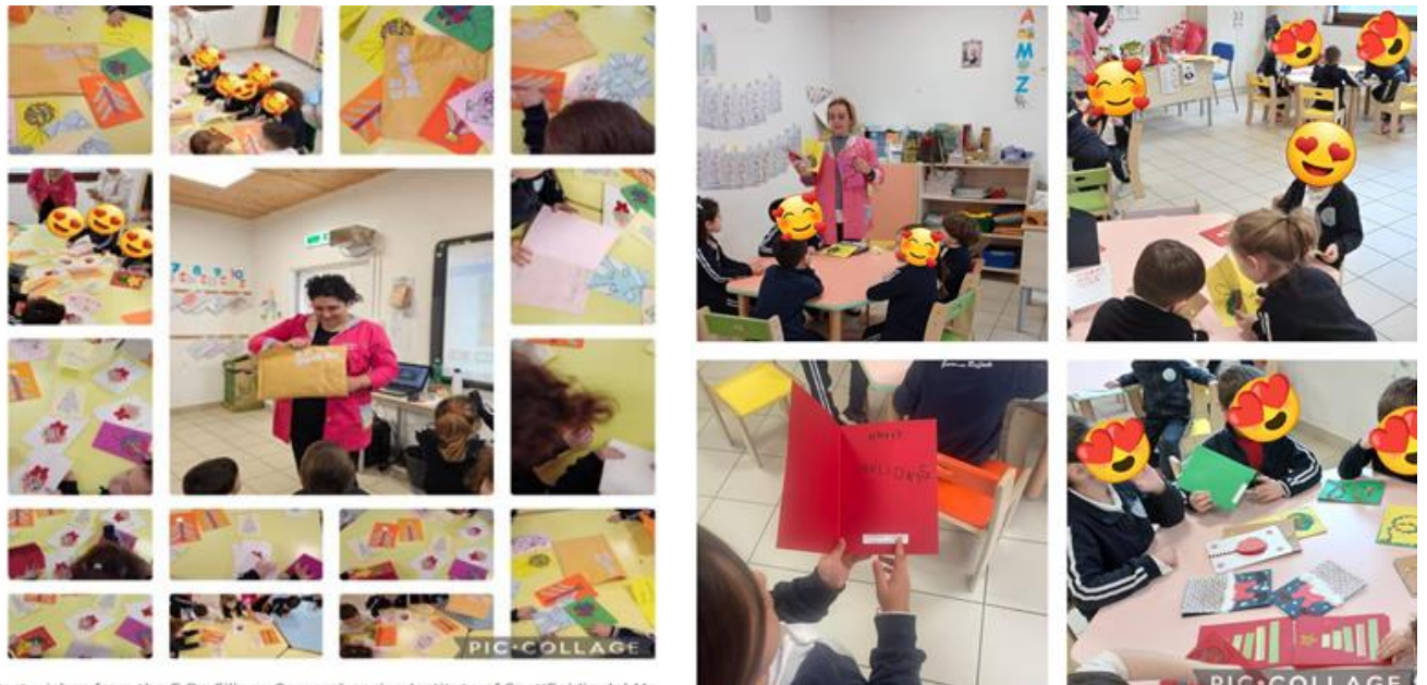
Best wishes from the E.De Filippo Comprehensive Institute of Sant'Egidio del Mo Albino Salerno Italy We received the postcards from Greece and we are very happy